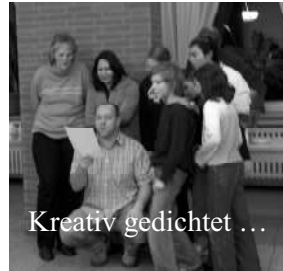
Kreativ gedichtet ...