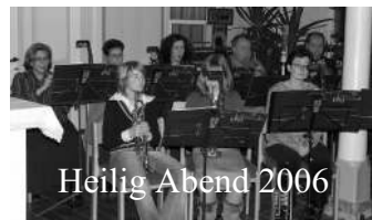
Heilig Abend 2006

saunenchor. 20 Menschen zwischen 10 und rund 60 Jahren machen Musik zum Lob Gottes und zur Stärkung der Gemeinde.