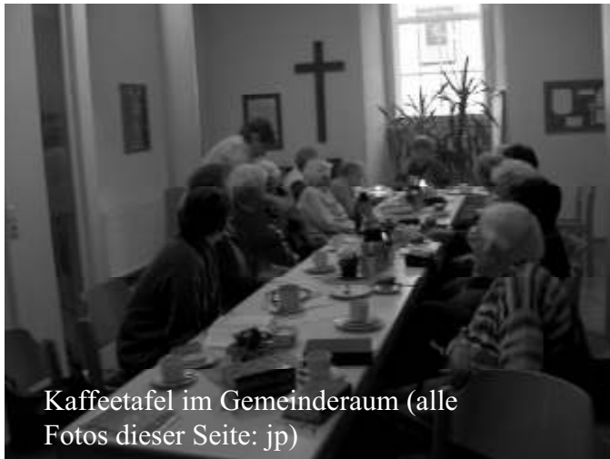
Kaffeetafel im Gemeinderaum

In der letzten Ausgabe des Gemeindebriefes fanden Sie auf dieser Seite einen Bericht über die großartige Feier zum 60jährigen Jubiläum der Frauenhilfe. Wenn sich auch die Damen der Frauenhilfe noch gerne daran erinnern, so ist doch die Zeit und damit auch das Leben der Evangelischen Frauenhilfe Wieda weitergegangen.