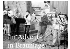
Im Advent in Braunlage

Ein besonderes Geschenk haben wir mit dem Po-