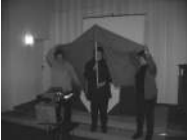
Unter Gottes Zelt vereint