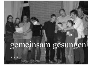
gemeinsam gesungen ...