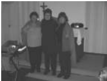
Von Gottes Zelt beschützt

Unter diesem Thema fand am Freitagabend der diesjährige Weltgebetstag der Frauen statt. Frauen aus Neuhof, Wieda und Tettenborn fanden sich in der St. Antonius-Kirche in Neuhof zusammen, um die Liturgie, die Frauen aus Paraguay gestaltet hatten, miteinander zu feiern.