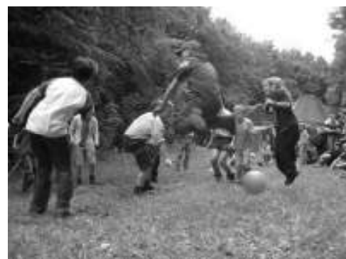
Beine hoch! Die Boje kreist.

tollen Programms kam überhaupt keine schlechte Laune auf. Ob Lagerbauten errichten, Tockern bei Nacht, Boje, Geländespiel, Singewettstreit, Versprechen sfeier, Pfingstgottesdienst, gemeinsames Singen in der Kaaba oder die gemeinsame Zubereitung der Mahlzeiten, immer war etwas los.