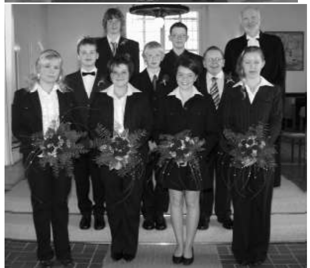
und in Neuhof am 22. April 2007