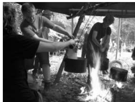
Extrem heiß war es beim Kochen am Kochtisch.

Dienstag noch folgen. Doch irgendwie arrangierte man sich mit dem Wetter. Und