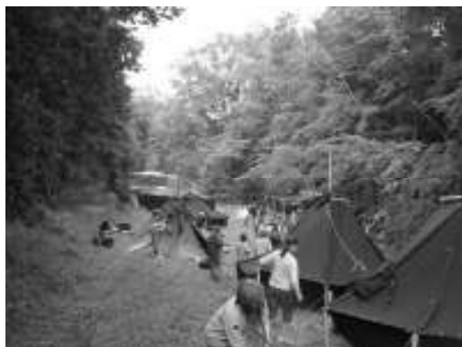
Freitagabend. Auf einer Schneise im Wald wird das Lager errichtet.

Zum ersten Mal, nahmen Walkenrieder in diesem Jahr am Pfingstlager des VCP-