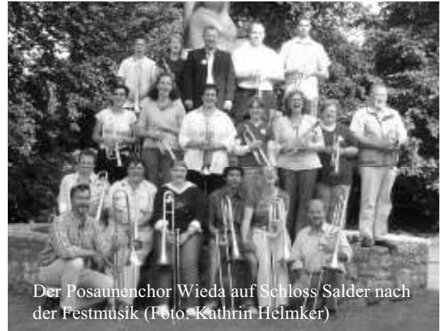
Der Posaunenchor Wieda auf Schloss Salder nach der Festmusik

ten dann sogar mit dem „Jungen Blech“ noch einen Sonderauftritt. Auch der Abend der Bläser im Anschluss verbreitete gute Stimmung. Sonntagmorgen spielten wir im Gottesdienst in der kleinen Dorfkirche in Leinde, um uns dann auf dem Schlosshof in Salder für die Festmusik um 16 Uhr vorzubereiten. Das Programm war schwerer als am Vortag, aber