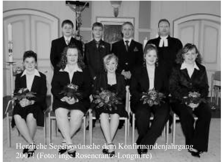
Herzliche Segenswünsche dem Konfirmandenjahrgang 2007!